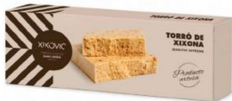
Barra 150 g