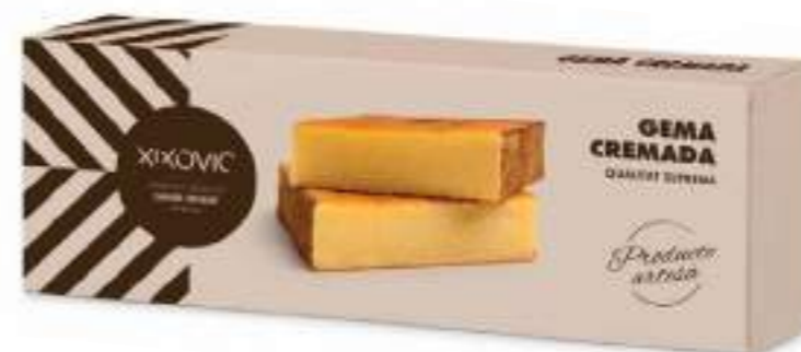
Barra 150 g 66 x 183 x 30 mm