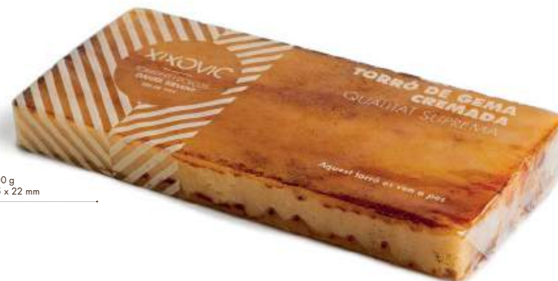
Barra 400 g 80 x 175 x 22 mm