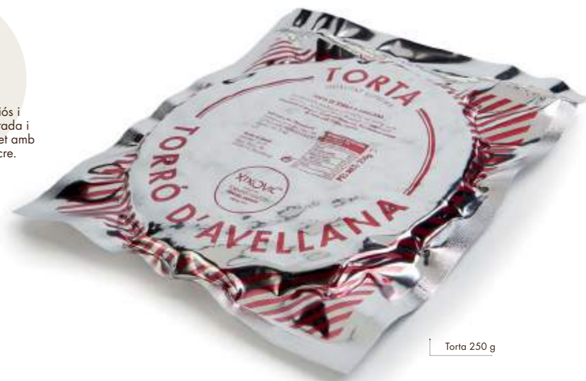
Torta 250 g