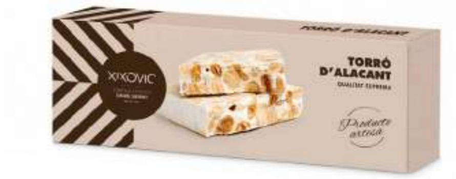
Barra 150 g