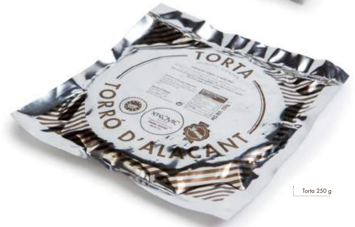
Torta 250 g