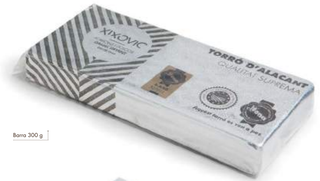
Barra 300 g