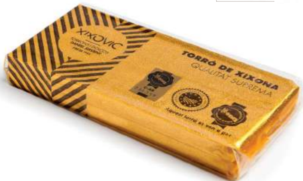
Barra 400 g 80 x 175 x 22 mm