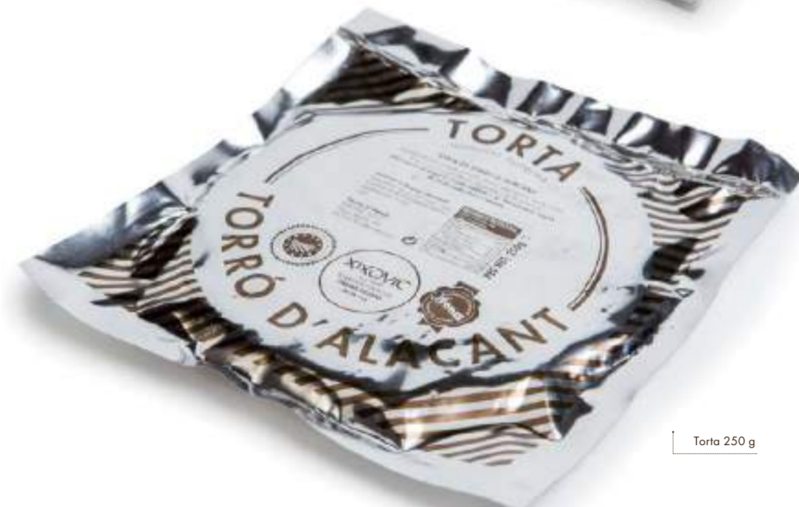
Torta 250 g