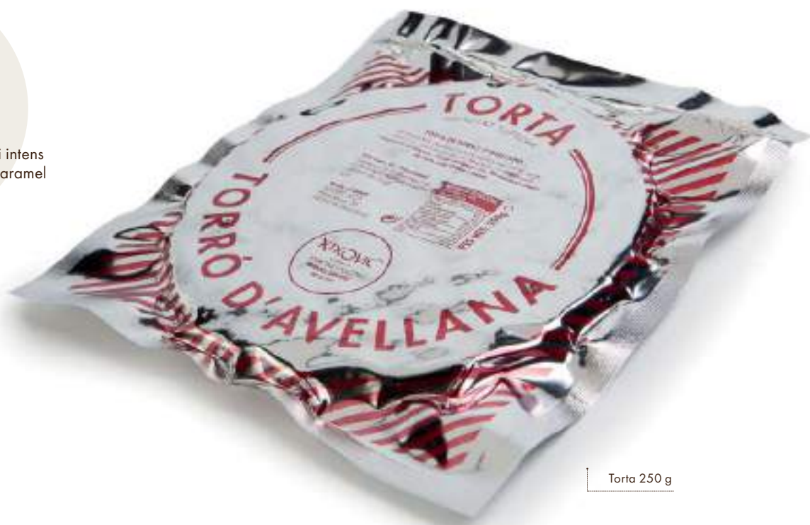
Torta 250 g