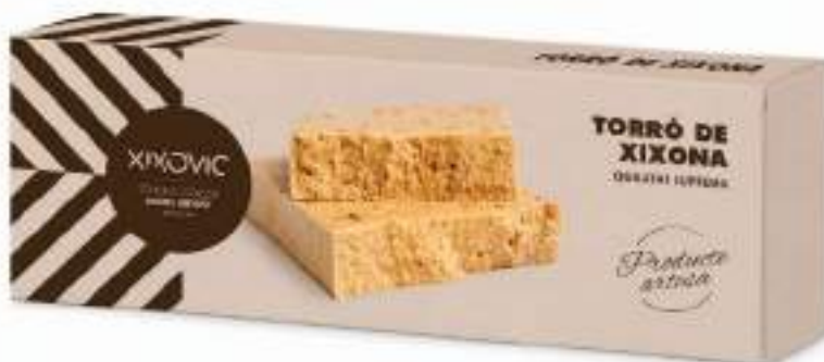
Barra 150 g