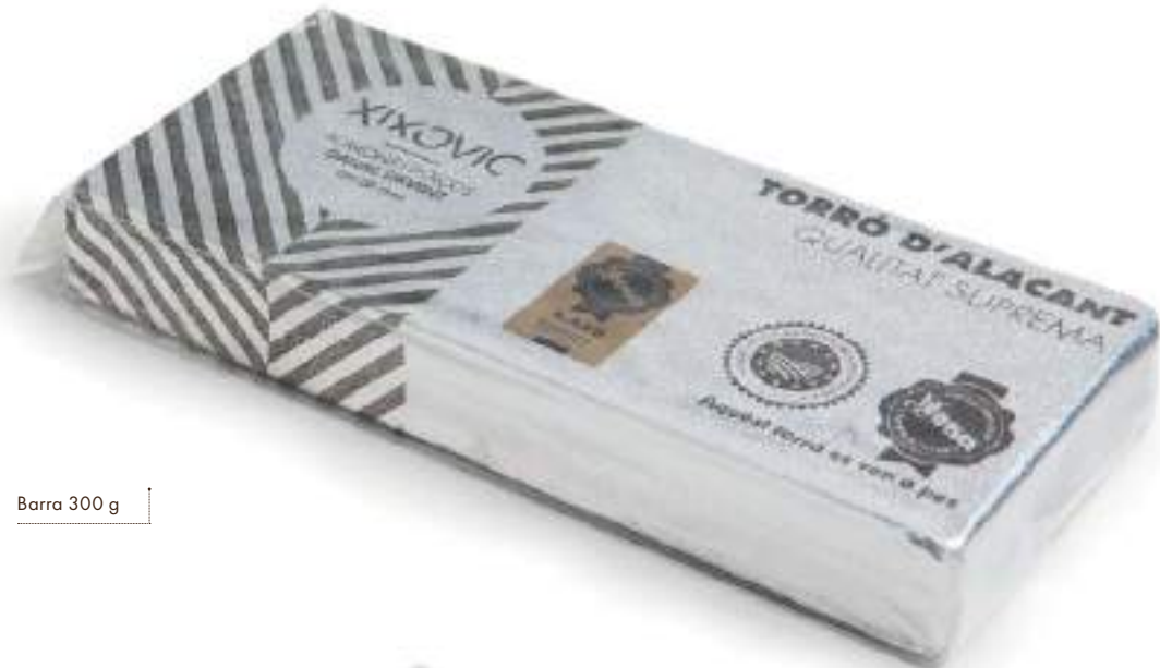
Barra 300 g