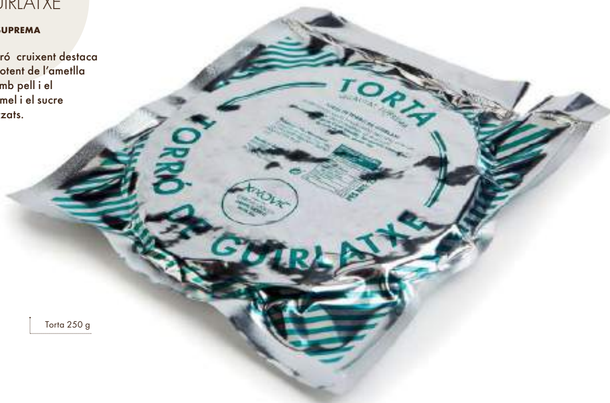
Torta 250 g

Aquest torró cruixent destaca pel gust potent de l'ametlla torrada amb pell i el gust de la mel i el sucre caramel·litzats.