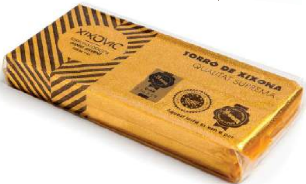
Barra 400 g