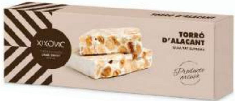
Barra 150 g