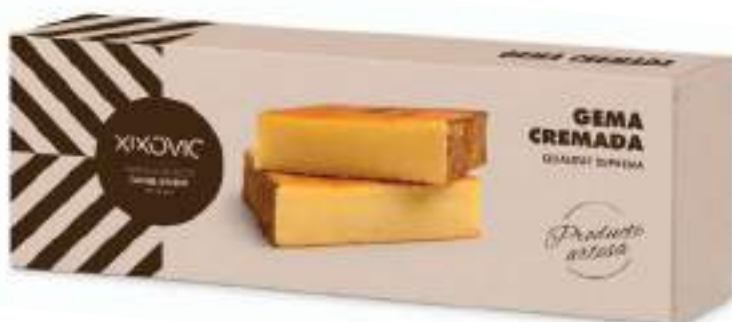
Barra 150 g 66 x 183 x 30 mm