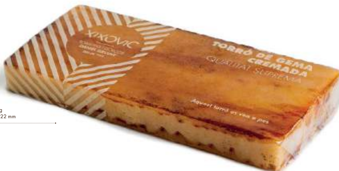
Barra 400 g 80 x 175 x 22 mm