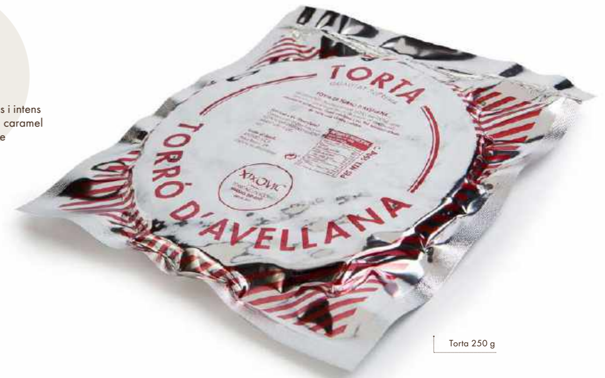
Torta 250 g