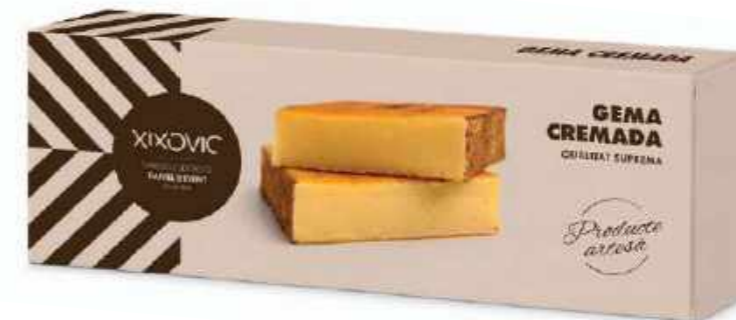
Barra 150 g 66 x 183 x 30 mm