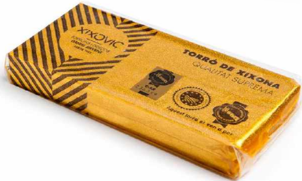
Barra 400 g