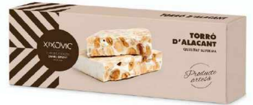
Barra 150 g