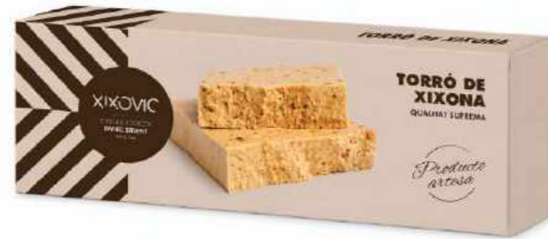
Barra 150 g