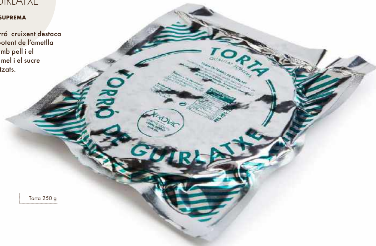
Torta 250 g

Aquest torró cruixent destaca pel gust potent de l'ameïlla torrada amb pell i el gust de la mel i el sucre caramel·litzats.