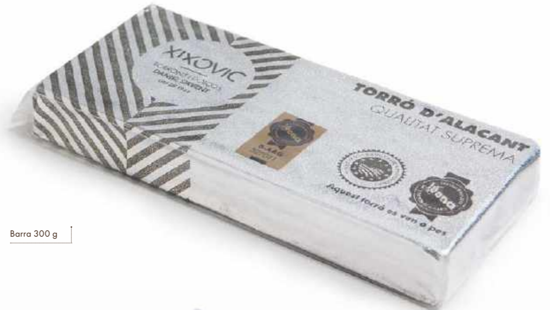
Barra 300 g