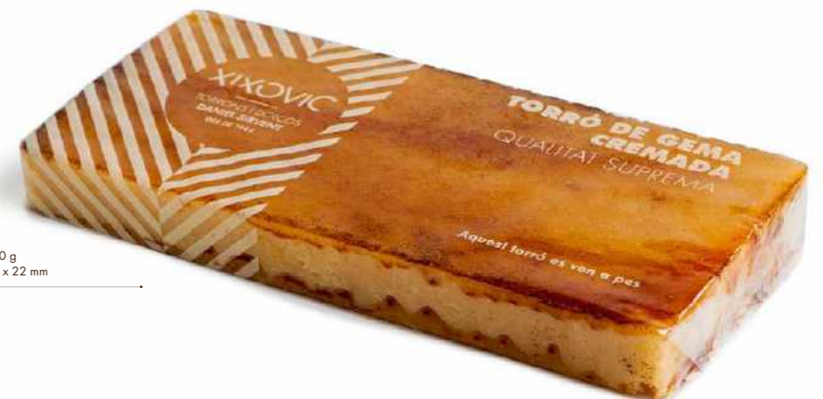
Barra 400 g 80 x 175 x 22 mm