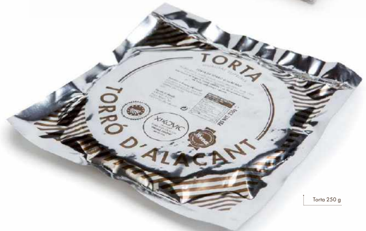
Torta 250 g